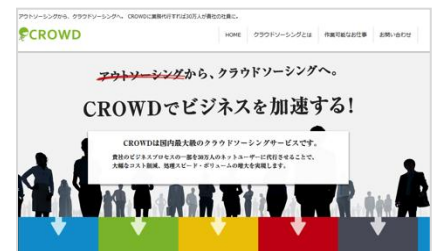
CROWD(クラウド)サイトクライアント向けTOPページ